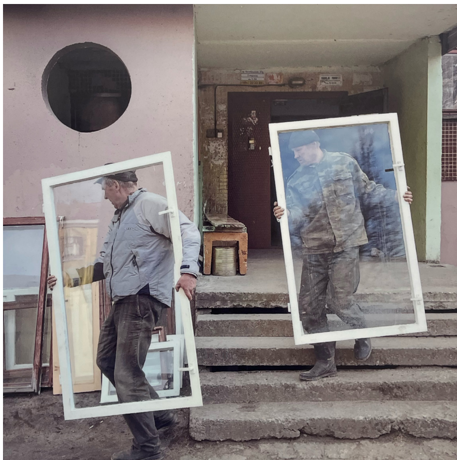
Ил. 1. Дмитрий Марков. Псков. 2017