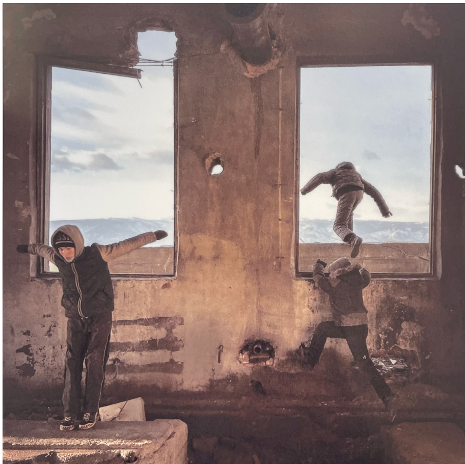
Ил. 3. Дмитрий Марков. Остров Ольхон. Байкал. 2016 © Фотограф Дмитрий Марков, предоставлено Татьяной Марковой

происходит тематическое и формальное пересечение с образной линией Мохорева. Прыгающие внутри рыжего бетона коробки дети на Байкале напоминают кадры из старых парадных Петербурга на снимках Мохорева конца 1980-х – начала 1990-х гг., а мальчик под конструкциями разрушенной пристани в Астрахани – как близнец кронштадтских пацанов, сигающих между бетонными развалинами фортов в 2000-е. И все-таки двух авторов разводит несколько отличий: безусловно, это цветность Маркова, колориста в духе уличных сценок Гвидо Рени 25 ,