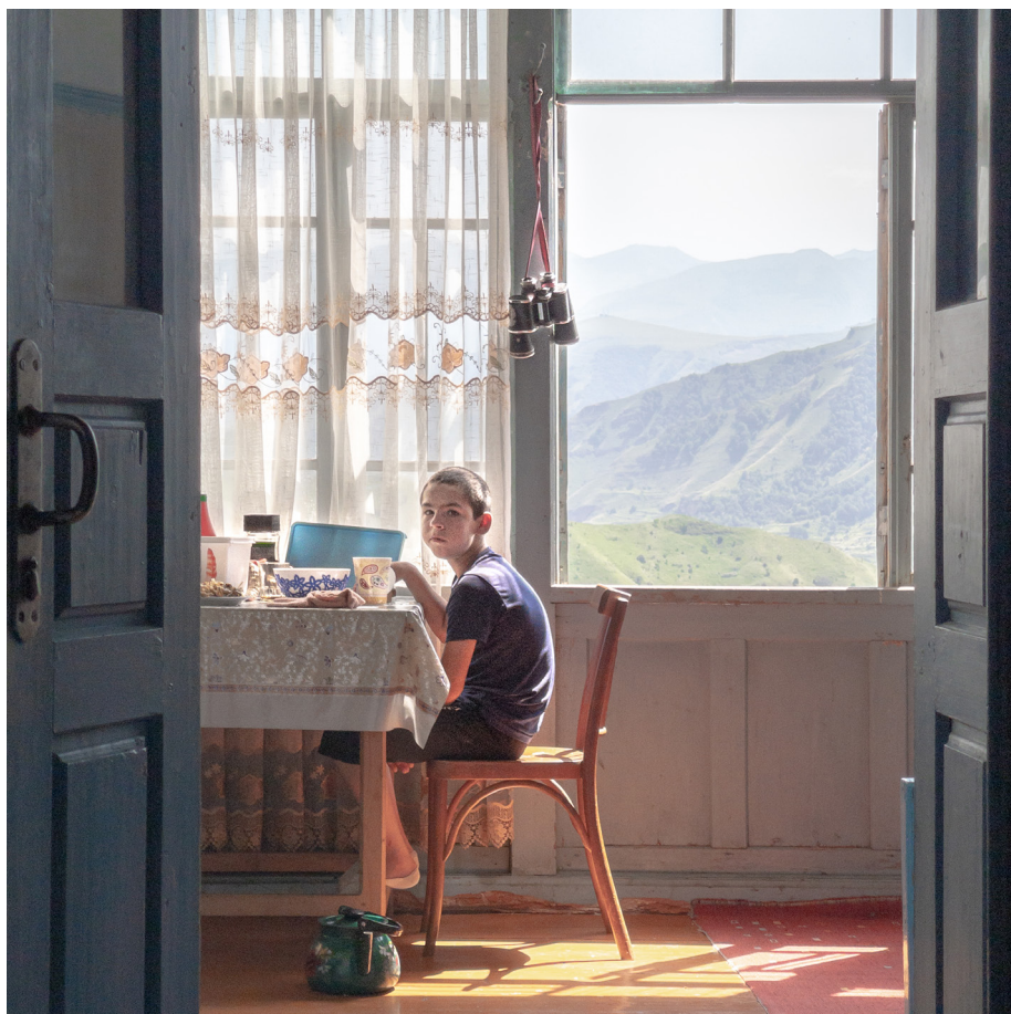
Ил. 10. Дмитрий Марков. Чох. Дагестан. 2021

возникает аллюзия на пейзажи с людьми из циклов «времена года» малых голландцев и тяготеющие к той же традиции студии окраин мегаполисов Александра Гронского. То, что Марков, перемещаясь по России, обращал внимание на те же знаки-сцепления архитектуры и человека, отражающие современность, что и другие авторы, говорит лишь о его наблюдательности и о том, что Марков размышлял над тем, как среда современного «мегаполиса попате» формирует людей, отдаляя их от природы и от исторических, не всегда эстетических, но знаковых констант, которые позволяют нам идентифицировать цивилизующее их пространство, прочитать людей на фотографиях через фиксацию их бытия.