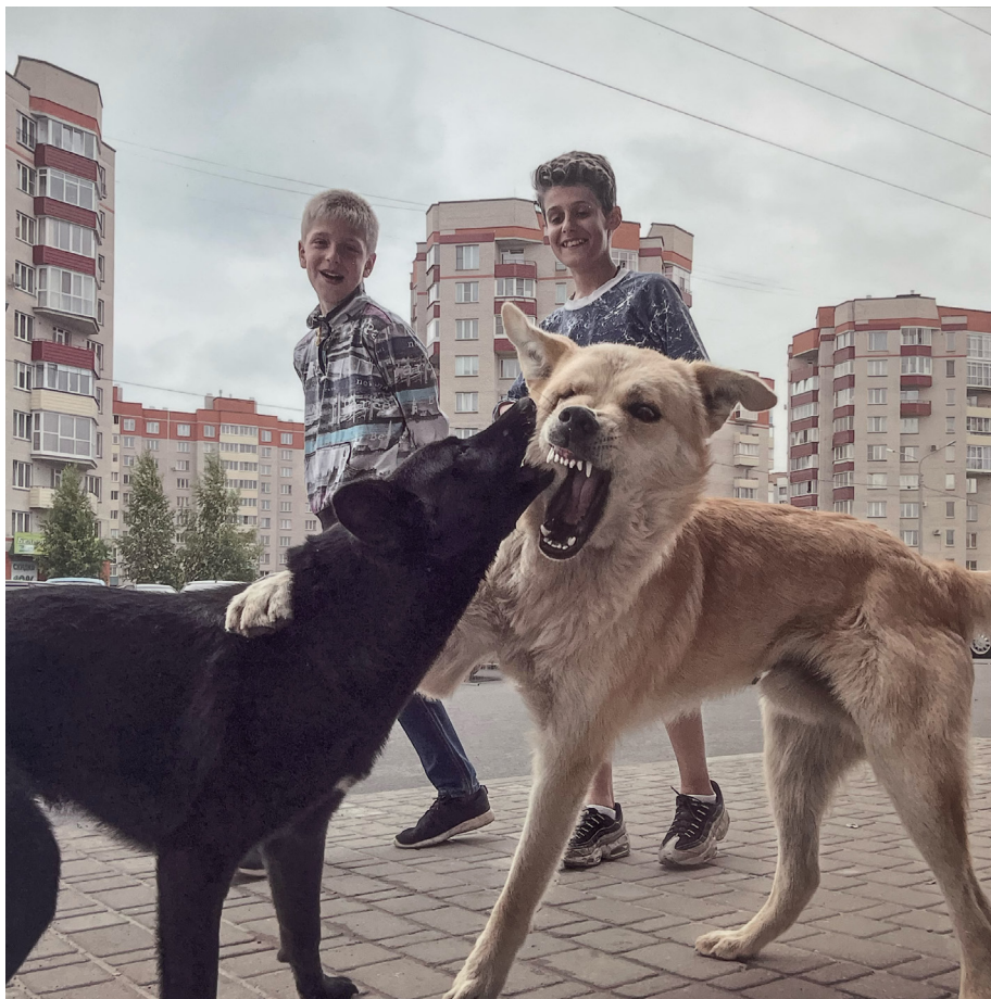
Ил. 8. Дмитрий Марков. Псков. 2017