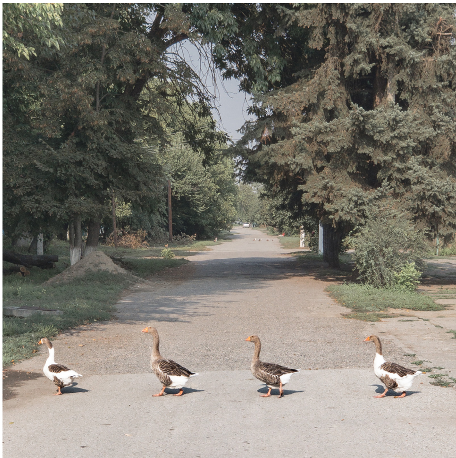
Ил. 5. Дмитрий Марков. Прохладный. Кабардино-Балкария. 2019

благодаря дару построения композиции, через геометрию и воздушность, когда не только фигура подростка, но снимок целиком оказывается угловатым, динамичным, наполненным бликами и отсветами, и так все пространство фотографии становится психологическим портретом.