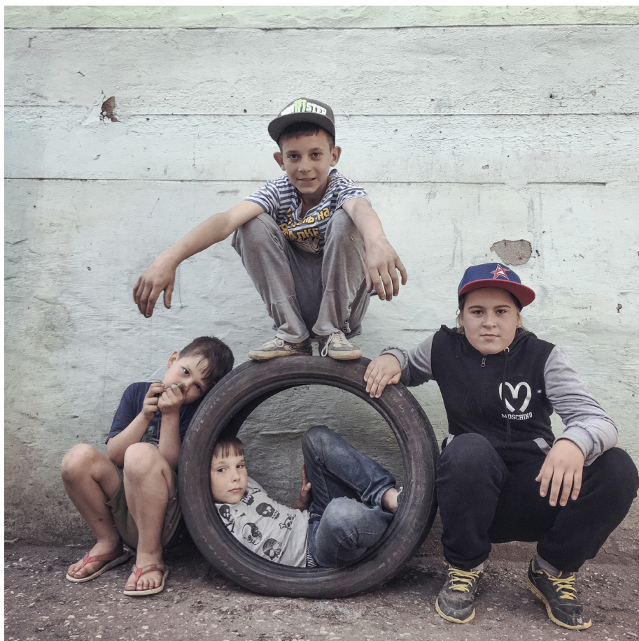
Ил. 7. Дмитрий Марков. Керчь. 2016