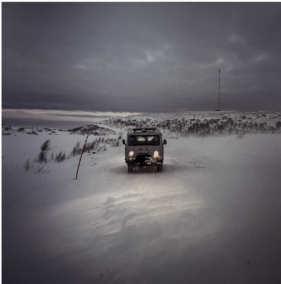
Ил. 2. Дмитрий Марков. Териберка. Мурманская область. 2015

заснеженного плоского пейзажа. Кажется, что зритель может услышать звук вьюги, заметающей дорогу, которая вот-вот в приближающейся ночи станет неразличимой на поле снега. Этот кадр эмоционально захватывает любого. И, возможно, кто-то из сторонников концепции фотографии как глобального языка современности уверенно использует этот кадр как иллюстрацию того, насколько изображение может быть декодируемым вне зависимости от сопровождающего его текста и контекстности восприятия сюжета. Но зритель внутри русской культуры начала XXI в. увидит в этой фотографии больше, и она ляжет на другую почву восприятия: у зрителя, принадлежащего к поколению самого фотографа,