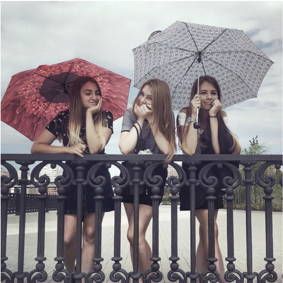
Ил. 6. Дмитрий Марков. Краснодар. 2016

для разнообразия, прикрытые в своей геометрической очевидности кущами деревьев и их тенями; а в нижней части разыгрывается горизонтальное представление из четырех подобных фигур, расположенных по горизонтали в одну линию на фоне скучнейшей геометрии пейзажа. Но для всех, кто живет в фотографическом пространстве, в этой фотографии существует несомненная аллюзия на снимок Йена Макмиллана 26 «Четверка Биттлз на Аббей-Роуд» (1969). Уподобление поп-музыкантов гусям, важно шествующим по дороге или,